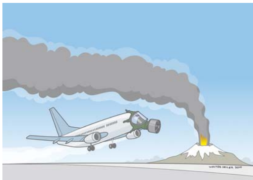
Er spuckt weiter

Das Netz der Europäischen Verbraucherzentren (EVZ-Netz) hat im Internet nützliche Informationen und Standardschreiben für geschädigte der Flugausfälle durch die Vulkanasche veröffentlicht. Neben vorformulierten Briefen finden sich hier auch viele rechtliche Hinweise zu den Verbraucherrechten im Falle von Flugausfällen. Um diese in Zukunft zu vermeiden, einigten sich die europäischen Verkehrsminister in Brüssel darauf, einheitliche europäische Messwerte festzulegen.