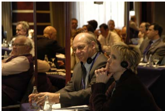
Nachdenkliche Tagungsteilnehmer