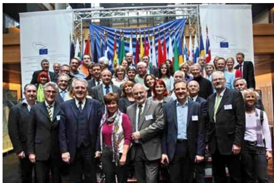
Bildungsplaner mit Rainer Wieland MdEP, dritter von links vorne, links daneben BBW-Chef Volker Stich

Vom 15. bis 17. April tagten auf Einladung der dbb akademie Bildungsverantwortliche der dbb Mitgliedsorganisationen in Straßburg. Die Gruppe sprach unter anderem mit dem CDU-Politiker Rainer Wieland, einem der Vizepräsidenten des Europäischen Parlaments, über Perspektiven der europäischen Integration.