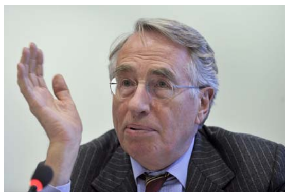
Wolf Klinz zur Griechenlandkrise: „Die Sanierungsvorschläge scheinen mir nicht ausreichend zu sein“

Klinz: Ich hätte es in der Tat vorgezogen, wenn der Rat schneller auf die Krise in Griechenland reagiert hätte. Das Europäische Parlament war in diesem Zusammenhang nicht gefordert, hat aber schon von Anfang an klar Stellung bezogen, nämlich: keine Schuldenübernahme durch andere Euromitglieder, aber Kreditgewährung, ein ehrgeiziges Restrukturierungs- und Sanierungsprogramm der griechischen Regierung, Verschärfung der Kontrolle durch die Kommission und Einführung klarer Sanktionsmechanismen.