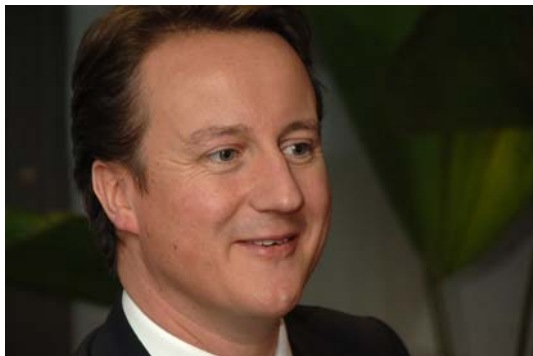
Will David Cameron Großbritannien regieren, muss er seine Tory-Partei auf Europakurs bringen, eine schwierige Aufgabe

Die Briten sind Koalitionsregierungen nicht gewohnt. Sie besitzen in dem stark auf Konfrontation ausgelegten Wahl- und Regierungssystem des Vereinigten Königreichs keine tragfähige Tradition.