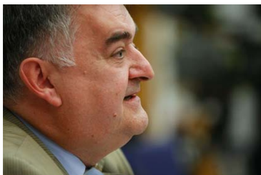
Herbert Reul

Deutlich fällt die Kritik des Parlamentariers an José Manuel Barroso aus: „Der Kommissionspräsident versucht einfach, eine neue Duftmarke zu hinterlassen, und denkt dabei weniger an die langfristige Wirkung als an den kurzfristigen Effekt.“ Die neue Strategie werde mal eben so durch die Institutionen `gehuscht`, bemängelt Reul. Der Zeitplan sei „überhastet“. Auf diese Weise gewinnen die Kommission nicht die Unterstützung aller Beteiligten. „So eine Strategie braucht Zeit und eine gemeinsame Debatte“, sagt Reul und erinnert daran, dass auch das Parlament und alle 27 Mitgliedstaaten mitmachen müssen.