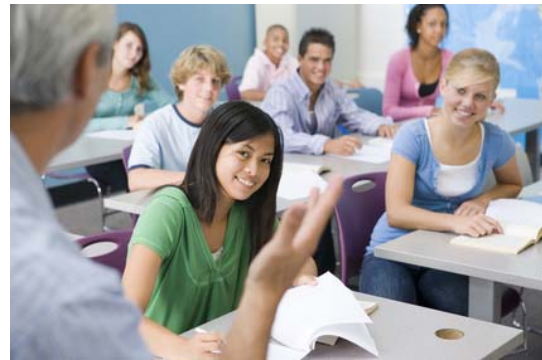
Europa in der Schule macht Spaß

„Die europäische Kooperation im Schulbereich ist eine Erfolgsgeschichte“, sagt Ludwig Spaenle, Präsident der Kultusministerkonferenz, im Vorwort der KMK-Veröffentlichung. Diese beinhalte, so Spaenle, Beispiele guter Praxis aus allen Bereichen des Programms. COMENIUS habe sich als ein wichtiges Instrument erwiesen, um die europäische Integration im Schulleben aktiv zu gestalten. „Besonders erfreulich dabei ist, dass COMENIUS und die europäische Kooperation im Schulbereich zu einem Programm für alle Schulen und Schularbeit in Europa geworden ist“, so Spaenle.