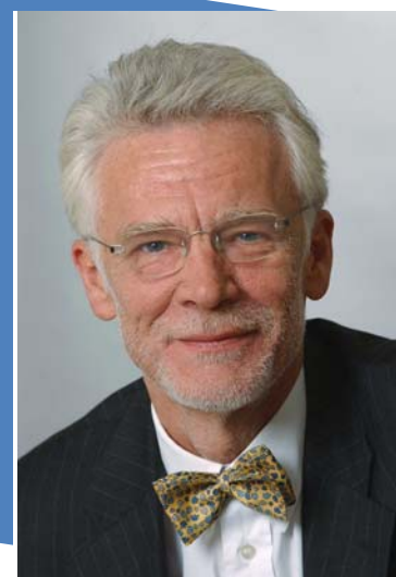
Jürgen Zöllner © Berliner Senat 2010

Das Fremdsprachenlernen kommt dann im schulischen Bereich dazu. Berlin setzt dabei auf ein vielfältiges Angebot an Schulprofilen. So bietet etwa die Staatliche Europa-Schule an 29 Standorten neun Sprachkombinationen an. Rund 6000 Schülerinnen und Schüler besuchen diese bundesweit einmaligen Einrichtungen. Ziel des Schulversuchs ist die integrierte Erziehung bilingualer Lerngruppen in einem durchgehend zweisprachigen Unterricht. Jede bilinguale Sprachkombination an einem Standort der SESB behandelt die jeweilige Mutter- und Partnersprache gleichrangig. Mit dem Erwerb der Partnersprache sind soziale Erfahrungen und kulturelle Aktivitäten verbunden. Die Kinder bekommen Einblick in die Kultur des Landes der jeweiligen Partnersprache. Schülerinnen und Schüler, die derart intensiv mit der Sprache in anderen (europäischen) Staaten vertraut gemacht werden, haben beste Voraussetzungen für eine weitere Ausbildung, Studium oder Berufstätigkeit in einem anderen Land oder in verschiedenen Ländern. Auch die anderen Schulen in Berlin haben vielfältige Schwerpunkte im sprachlichen Bereich.