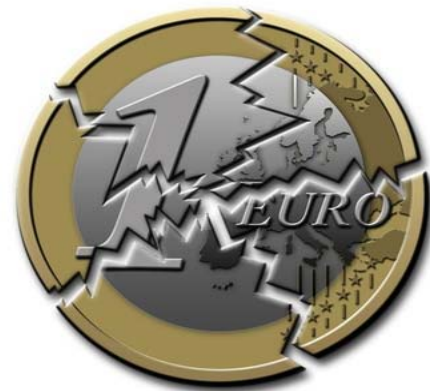
Was gefährdet den Euro? Griechenland? Oder der europäische Umgang mit der griechischen Schuldenkrise?

überall hohe, im Sinne der Maastrichtkriterien und des Stabilitätspakts zu hohe Verschuldungsstände aufweisen. Jene Experten, die zur Wiedereinführung der Drachme raten, sagen, Griechenland könne dann abwerten und zudem einen Teilschulderlass erzwingen. Es würden - marktwirtschaftlich korrekt - Gläubiger Geld verlieren, nicht der Steuerzahler. Das träfe zwar auch deutsche Banken, die inzwischen so gut wie verstaatlicht sind. Damit wäre auch wieder der Steuerzahler betroffen. Die Abschreibung wäre aber einmalig und kein Fass ohne Boden. Zudem, so warnen die Kritiker des jetzt vereinbarten Weges, droht Griechenland ohne die Möglichkeit der Abwertung einer eigenen Währung ein jahrelanger sozialer Niedergang, wie ihn historisch nur das Deutschland Heinrich Brünnings gekannt hat. So oder so wird der Weg Griechenlands schwer. Erste Tote hat es schon gegeben. Ungarn, das vom IWF mit harter Hand saniert worden ist, hat heute eine europaskeptische, rechtspopulistische Regierung und eine sehr starke rechtsextreme oppositionelle Bewegung.