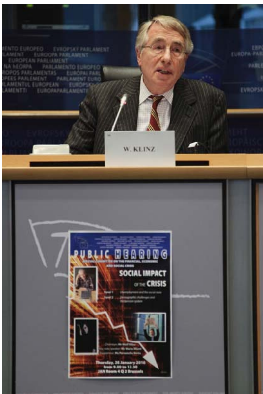
Wolf Klinz: Für die Einführung einer globalen Finanztransaktionssteuer

Klinz: Ein besserer Einblick in die nationale Haushaltserstellung könnte durch kritische Fragen und Plausibilitätskontrollen frühzeitige Hinweise auf Blasen geben oder sich ergebende Probleme erkennbar machen.